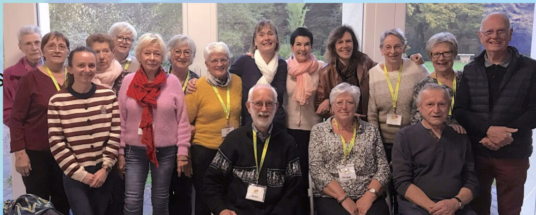
Journée de formation des visiteurs, Foyers Sainte Anne, Montferriand-le-Château, octobre 2025