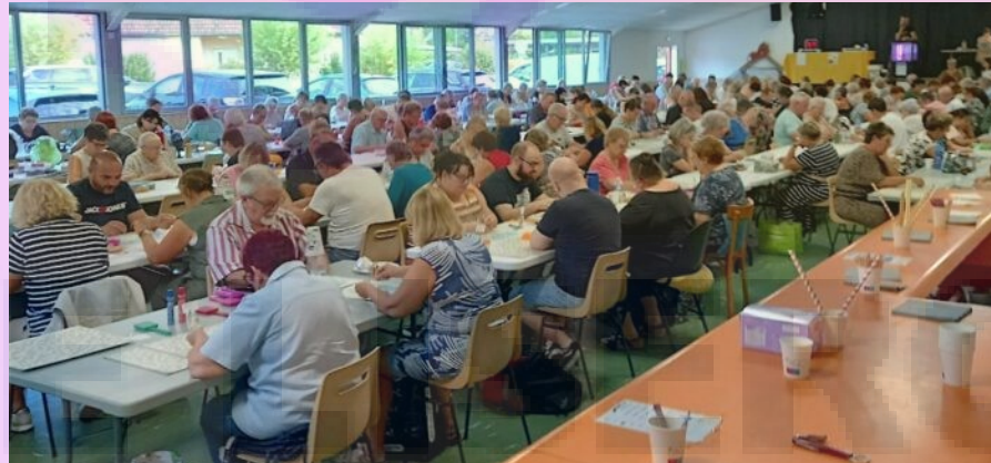
Loto à Bucey-lès-Gy, juillet 2025