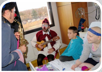
Les clowns en partenariat avec le rire Médecin, le mardi matin