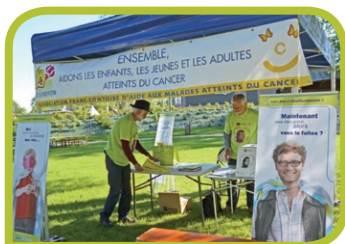
Stand lors d'une opération de sensibilisation au don de Moëlle osseuse