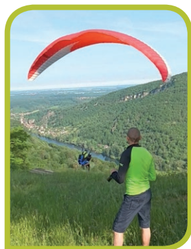
Vol en parapente