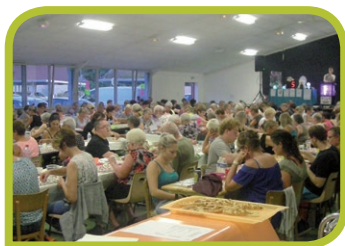
Loto de Bucey-lès-Gy