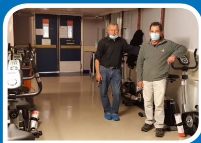
Achat et montage d'appareils d'entraînement par des bénévoles du Liseron

Merci et toutes mes amitiés à ces personnes.